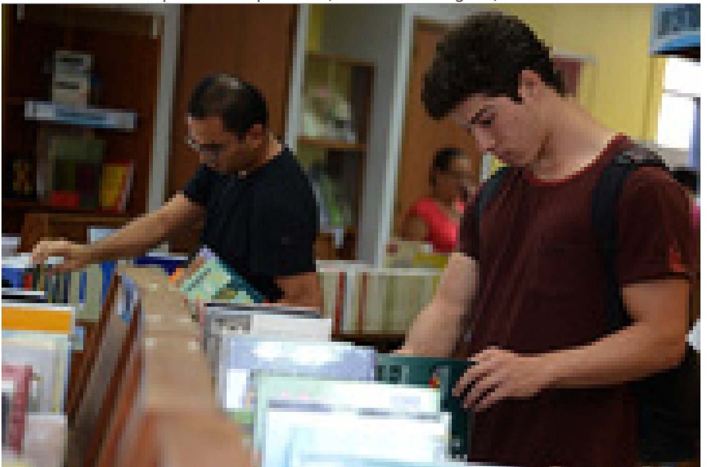
Los libros de texto son fundamentales para el desempeño académico de las y los universitarios y por eso están a la venta en la Librería UCR.