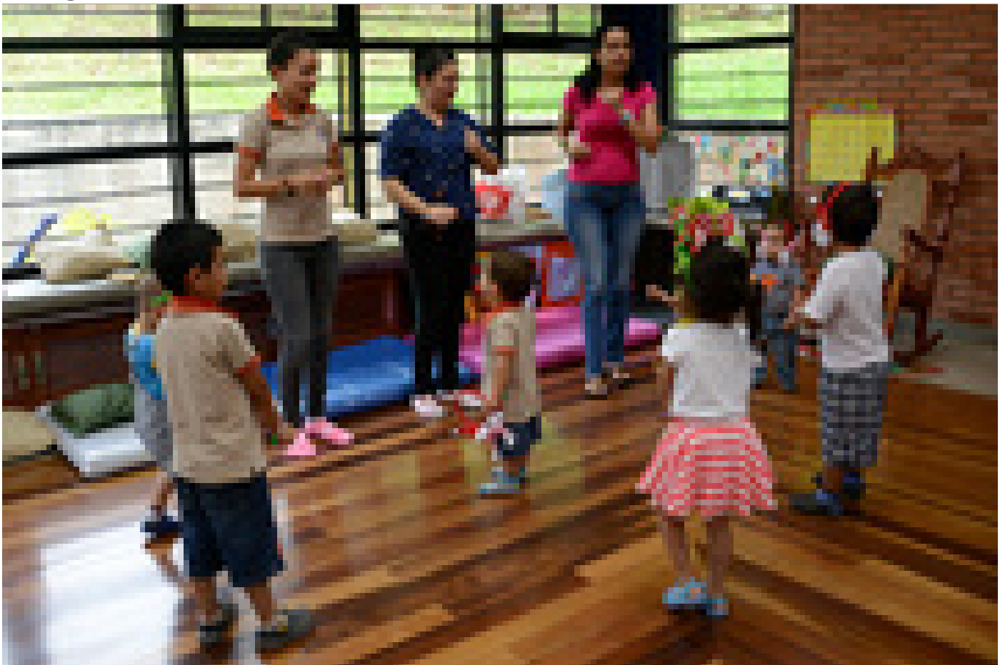
Las Casas Infantiles Universitarias se rigen por un reglamento aprobado por el Consejo Universitario y están a cargo de la Vicerrectoría de Vida Estudiantil.