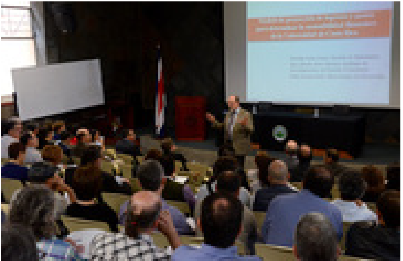
El Consejo Ampliado de Rectoría se efectuó en el auditorio de Ciencias Económicas.

También se revisarán los criterios de pertinencia mediante los cuales se reconocen a miembros del sector administrativo tanto remuneraciones extraordinarias como méritos académicos. También se aplicará la normativa en toda su extensión para la aprobación de jornadas de cuartos de tiempo adicionales para el sector docente.