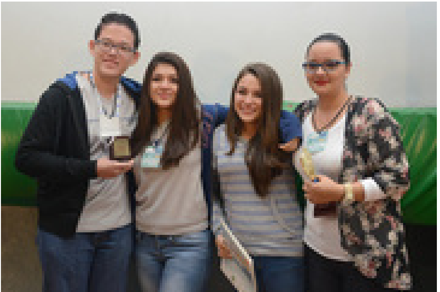
Los estudiantes ganadores del Gran Premio de la Feria Nacional de Ciencia y Tecnología 2014 de la UCR.