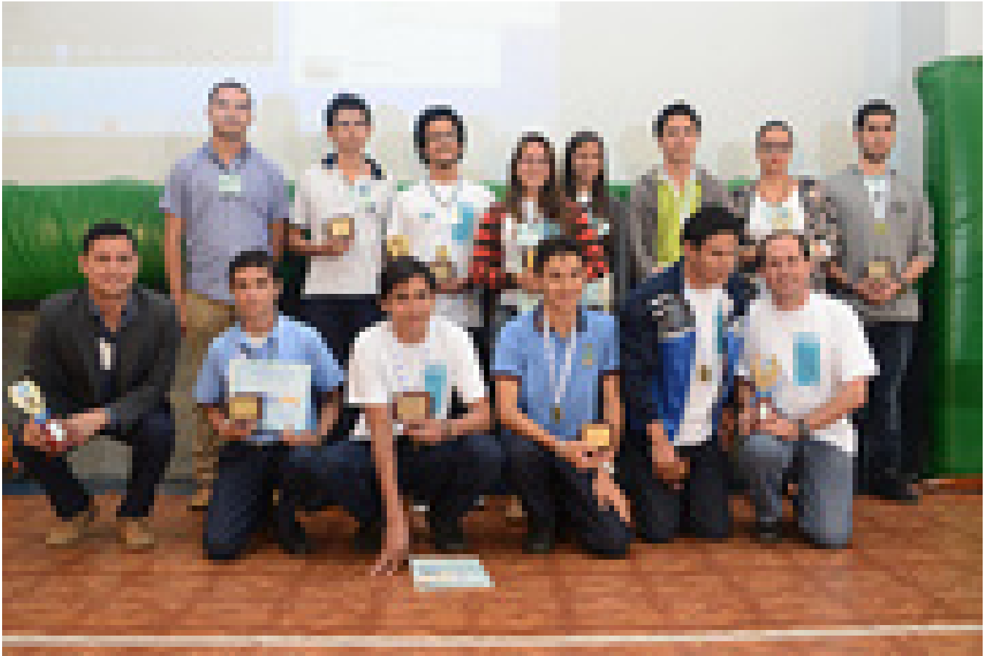
Estudiantes de los seis proyectos que participarán en el Costa Rica ISEF Challenge en el mes de diciembre.

educativos y sus tutores y tutoras, en las imágenes de esta galería fotográfica.