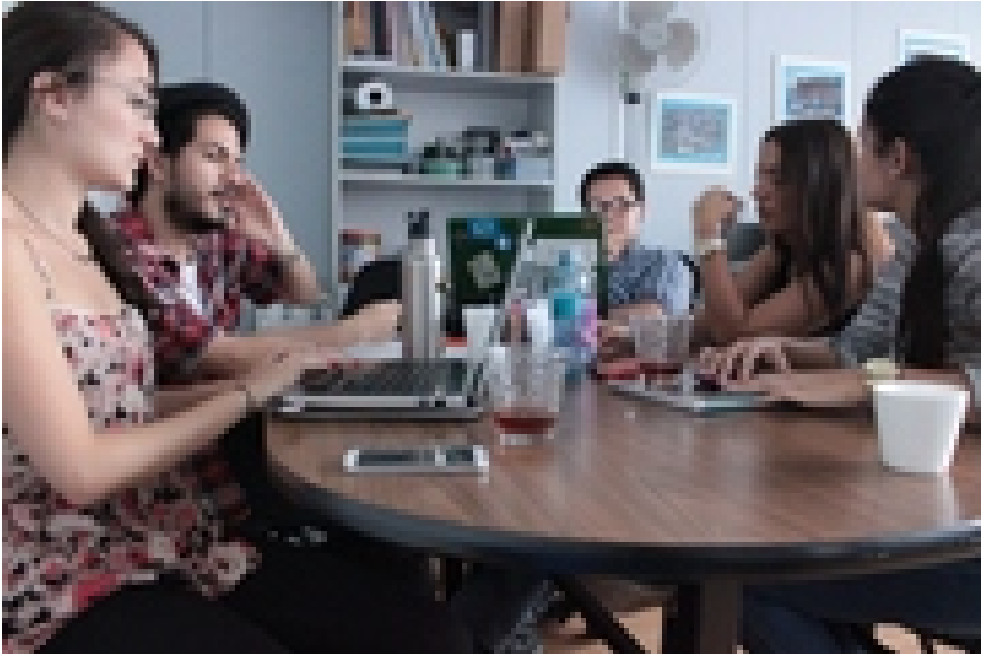
Estudiantes de los distintos énfasis de la ECCC ponen en práctica sus conocimientos en La Estación.