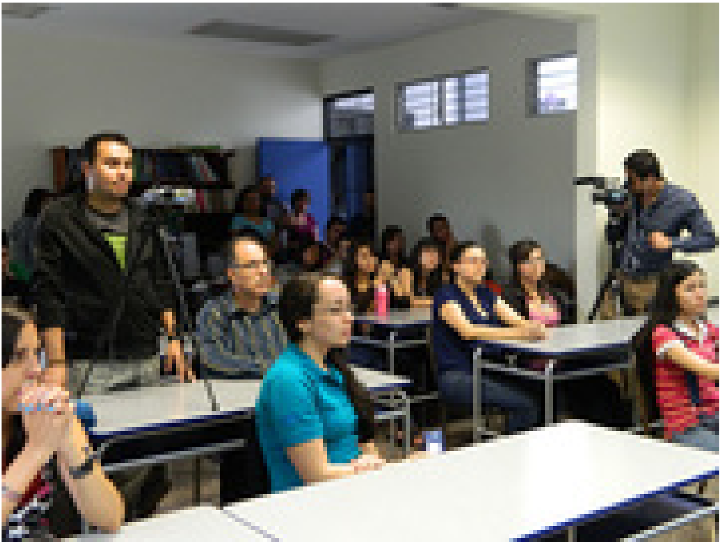
Estudiantes de la EBCI acudieron al acto de entrega del certificado otorgado a su unidad académica (foto María Peña).