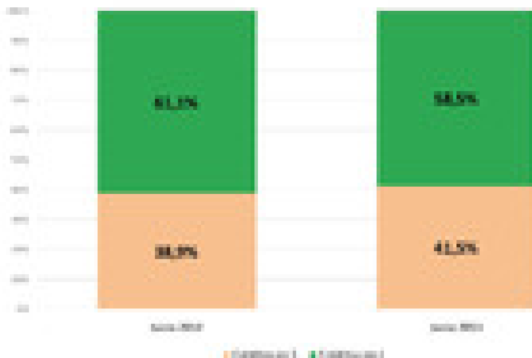
GRÁFICO 4 Composición del crédito hacia el sector privado en moneda extranjera (2012 - 2013)

Fuente: IICE con datos del Banco Central de Costa Rica.