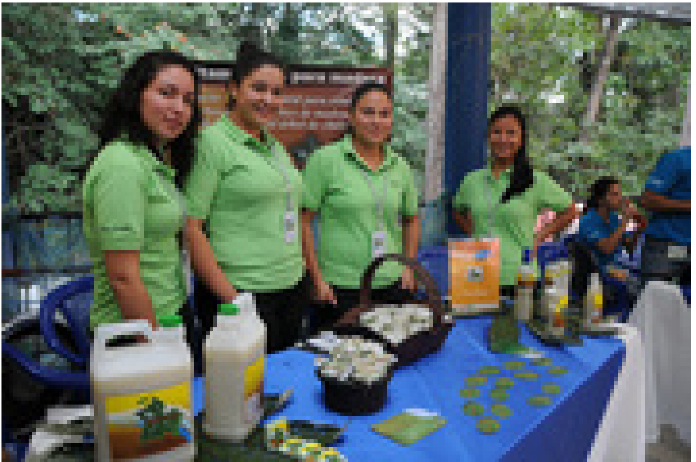
Chuclean es un quita manchas amigable con la naturaleza.

Como premio, los estudiantes de los tres primeros lugares recibieron un incentivo económico que aportó el Banco Popular 300 mil colones y un fin de semana en un hotel de playa en el caso del primer lugar; 250 mil colones al segundo lugar y 200 mil al tercer lugar.