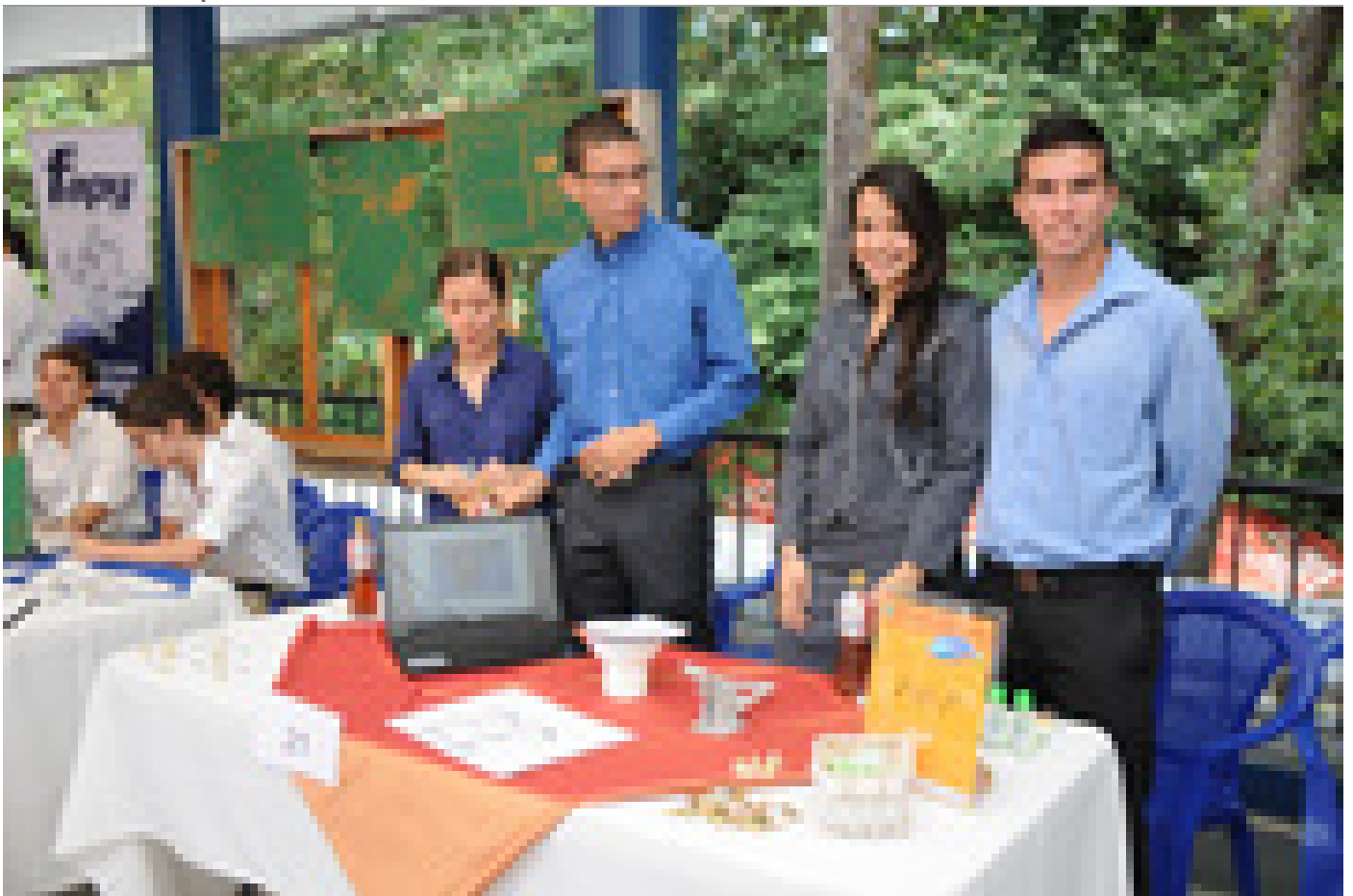
Push and Pee se adapta a cualquier servicio sanitario, es ideal para servicios públicos o para personas que tengan alguna incapacidad para usar sus extremidades superiores.