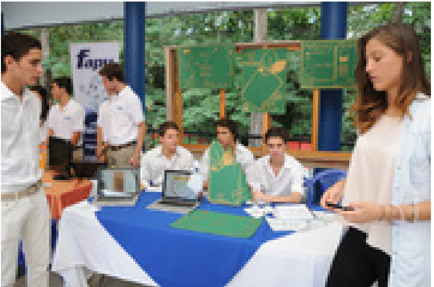
Ecoestuches para celulares busca reutilizar o reciclar materiales.