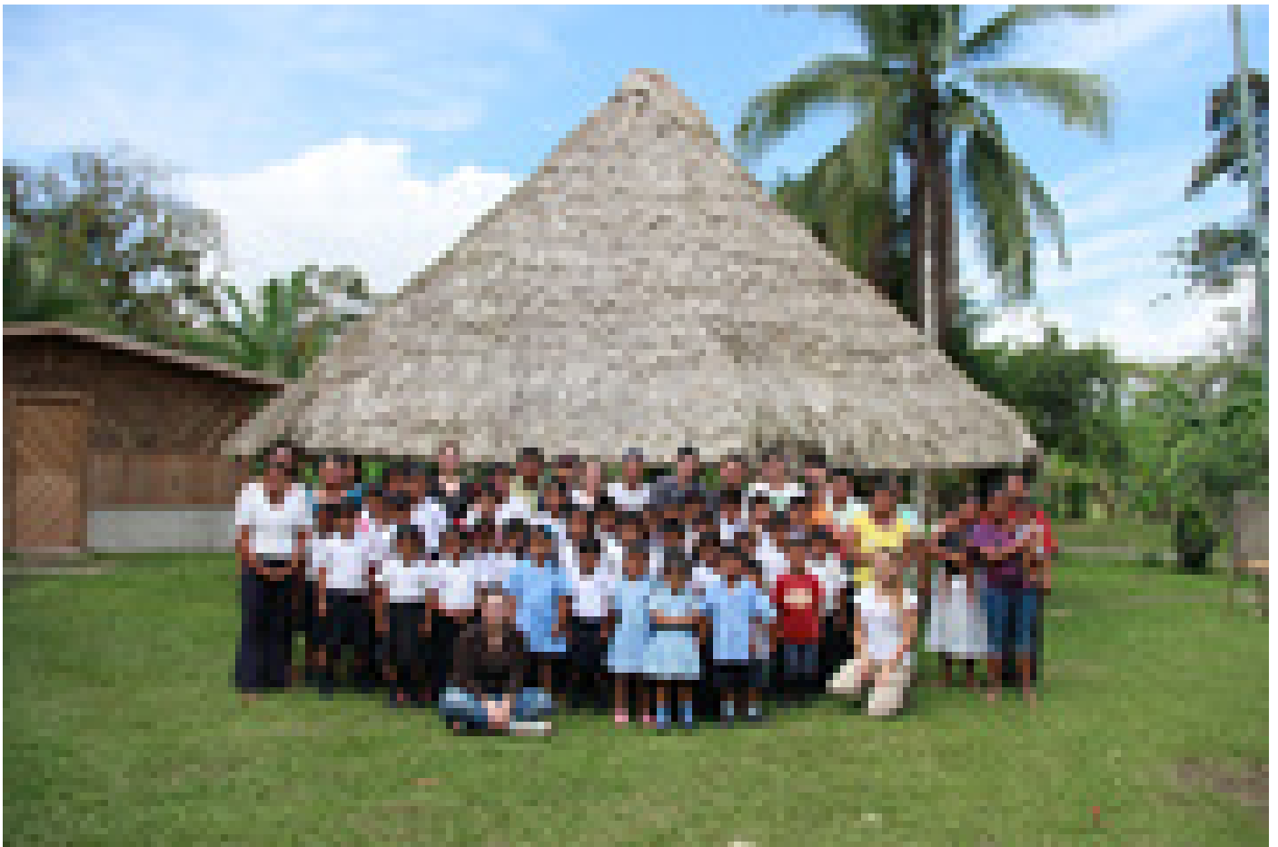
Las comunidades de Coroma y Bajo Coen, en la zona bribri de Talamanca, recibieron a la delegación universitaria encabezada por funcionarios del Instituto Clodomiro Picado