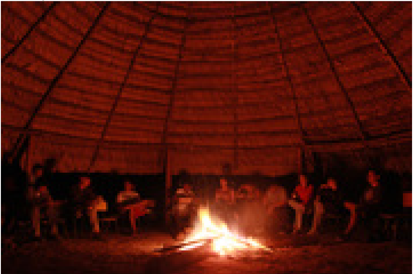
El convivio fue muy provechoso entre funcionarios del Instituto Clodomiro Picado, estudiantes universitario y los integrantes de las comunidades de Coroma y Bajo Coen, en