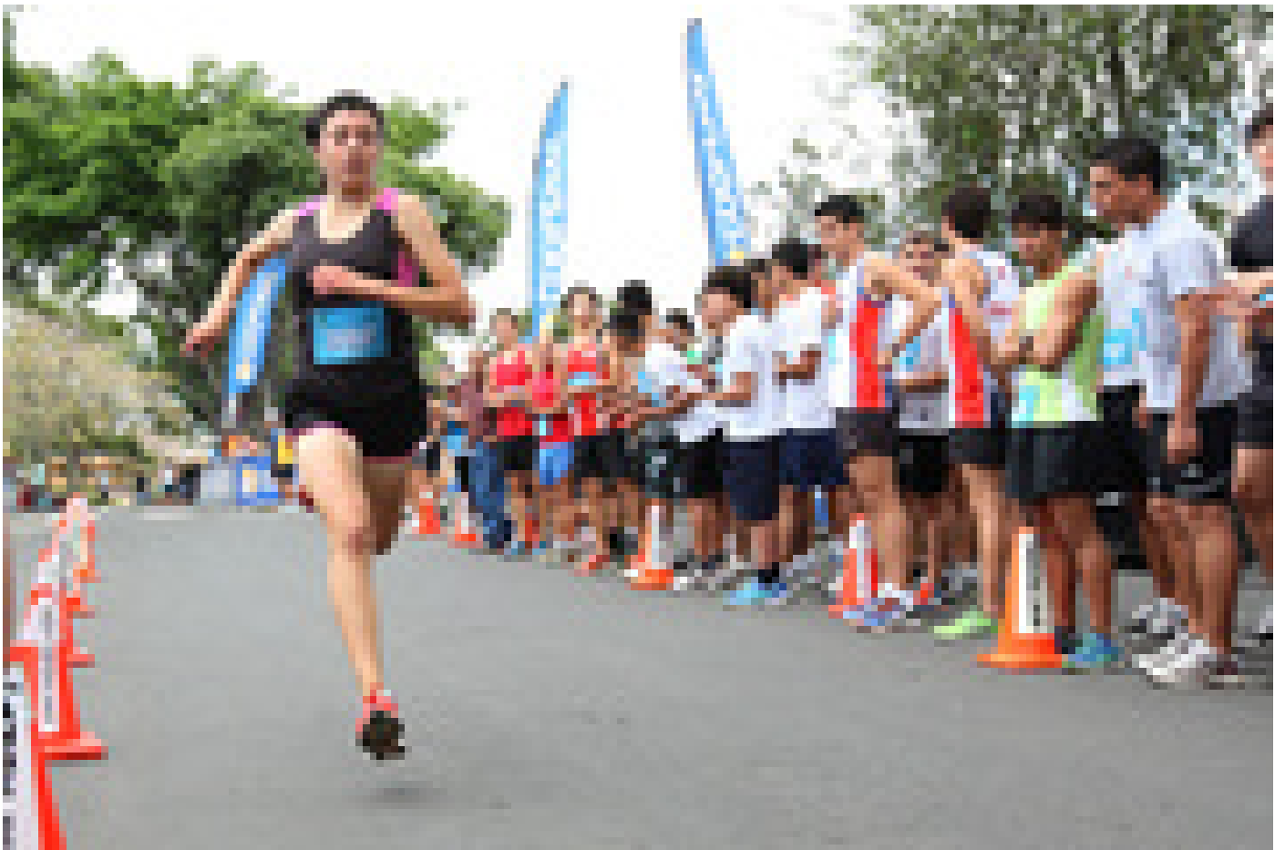
Una de las ganadoras de la categoría juvenil femenino, cuando estaba a punto de entrar a la meta ubicada frente a la Biblioteca Carlos Monge Alfaro.