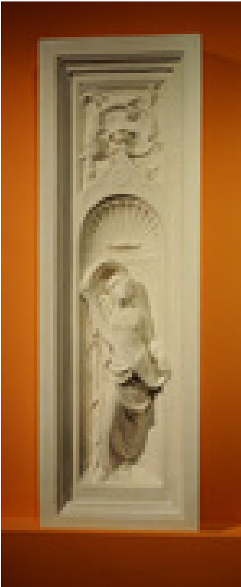
Profetisa. Detalle de la Puerta de Paraíso. Puerta este del Baptisterio de Florencia. Autor: Lorenzo Ghiberti (1425-1452).