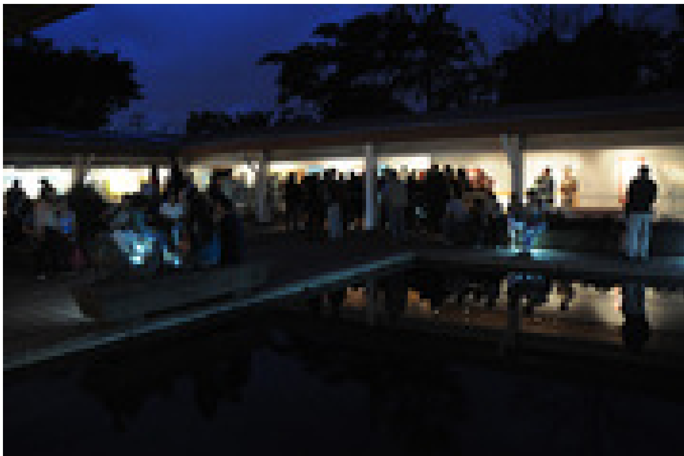
Vista general de la Galería de la Facultad de Bellas Artes.