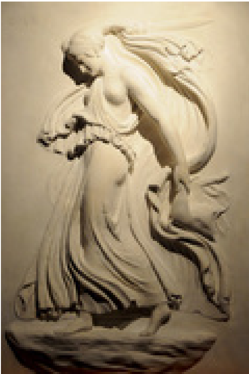
Ménade danzante. Bajorrelieve estilo neoático, cerca del 100 d.C. Villa Albani.

La mayoría de las piezas constituyen reproducciones de originales de la civilización greco-romana y de otros períodos como del antiguo Egipto, la Edad Media y del Renacimiento . Junto con ellas también se compró una colección de dibujos . Ambas adquisiciones servirían como recurso didáctico para enseñar dibujo.