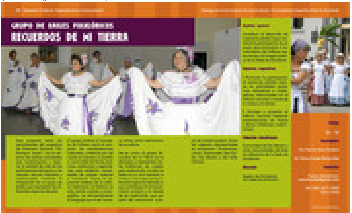
Las personas que consultan el catálogo pueden consultar la información de los grupos culturales que tiene la Sede (diseño Roger Alberto Ruiz).