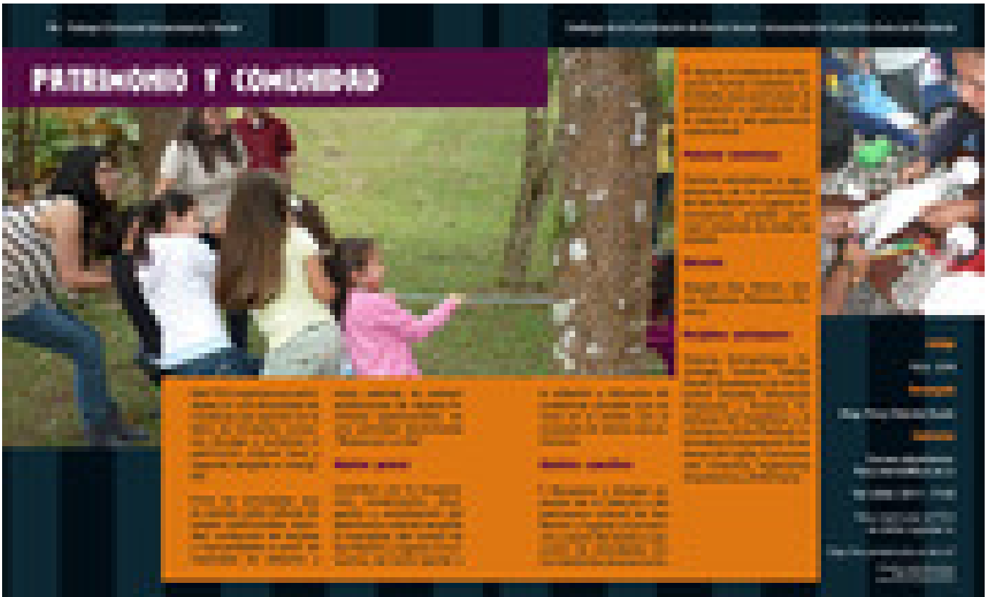
La información sobre los proyectos de TCU puede ser de gran utilidad para la comunidad (diseño Roger Alberto Ruiz).