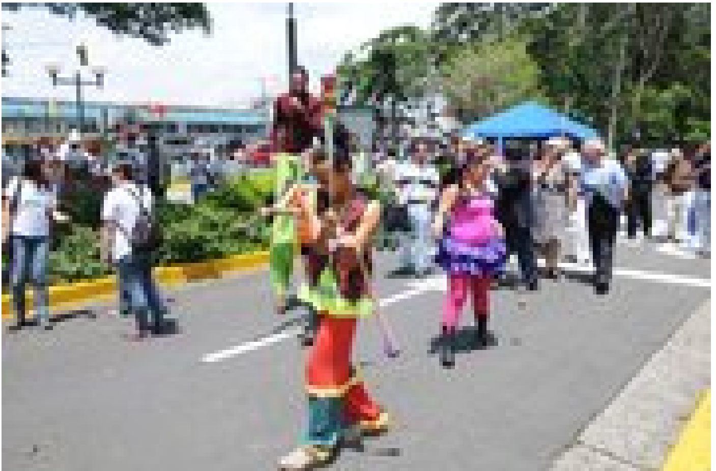
Estudiantes de la Escuela de Artes Dramáticas hicieron representaciones artísticas alusivas al Día Mundial del Ambiente.

En ese sentido, hizo un llamado a tomar “acciones reales de peatonización” dentro del campus que no se restrinjan a solo un día al año. “No estaríamos siendo los primeros en el mundo en limitar el ingreso de vehículos a nuestro campus, pero podríamos ser la primera institución que en el país tome un cambio de rumbo innovador”, agregó.