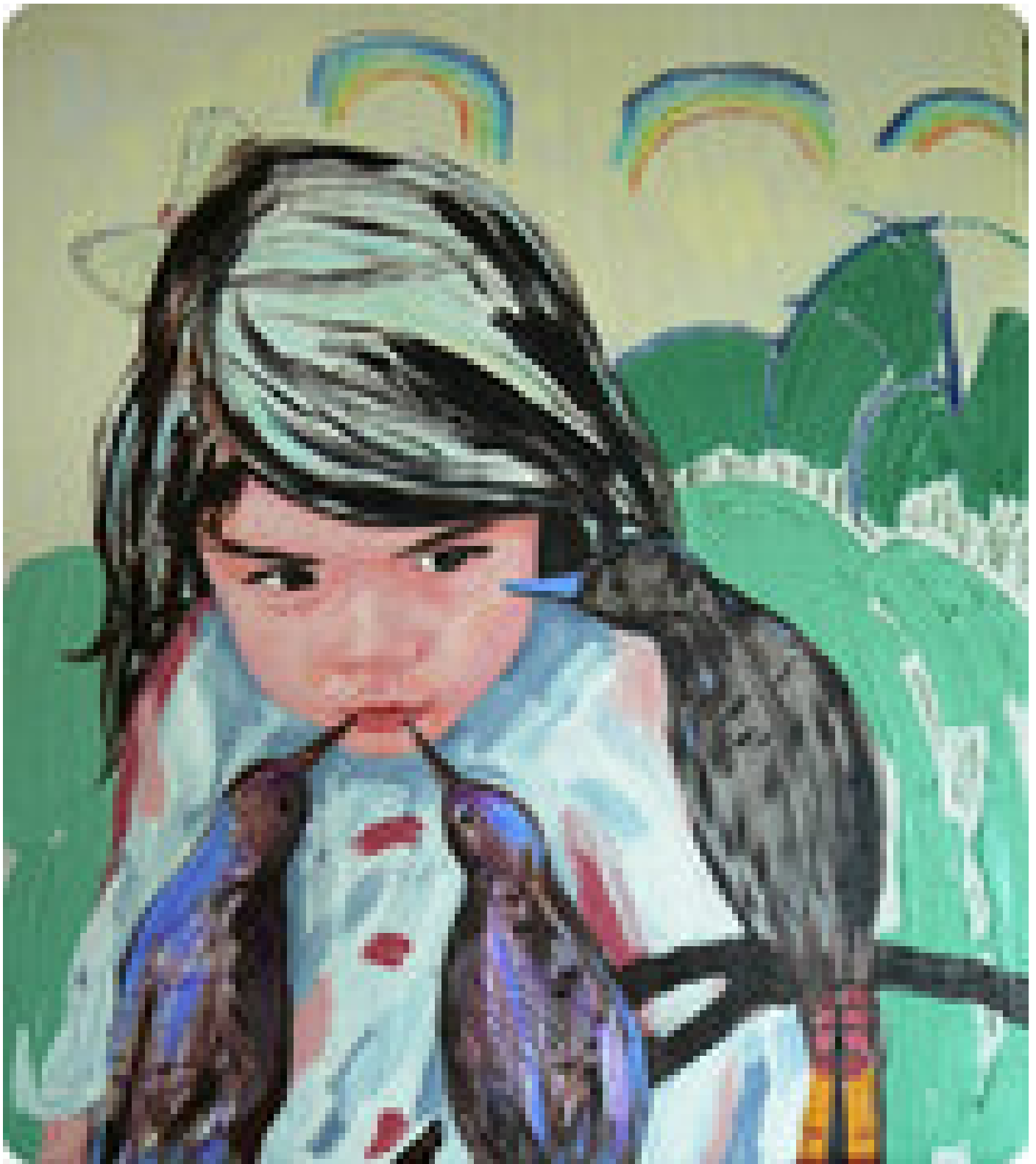
Obra "Luna despidiendo aves migratorias" (Imagen cortesía de Efraín Méndez).