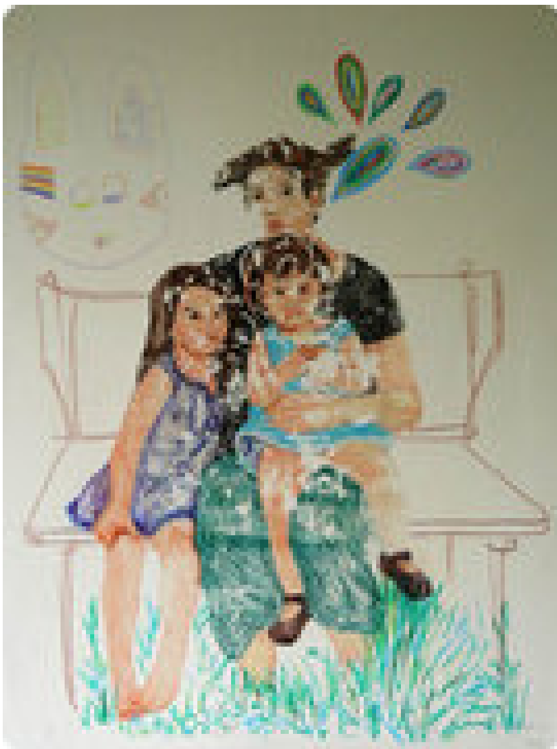
Obra "Nube aguardando la barca" (Imagen cortesía de Efraín Méndez).

Además, la noción de expresión creativa en la infancia resulta esencial para una serie de obras en las que el pintor trabaja actualmente, donde se crea un diálogo entre el objeto artístico ya hecho y la intervención que realiza un niño en él, un discurso entre lo vivido como recuerdo y el momento mismo de crear.