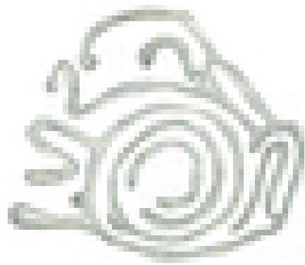
0001-01 0001-01 Turrailba, Costa Rica