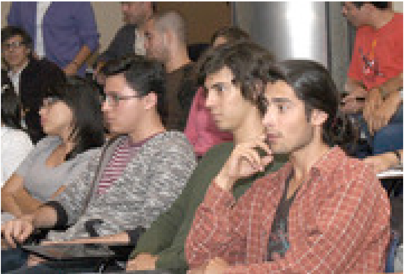
Estudiantes y docentes de varias unidades académicas en la presentación de la revista.