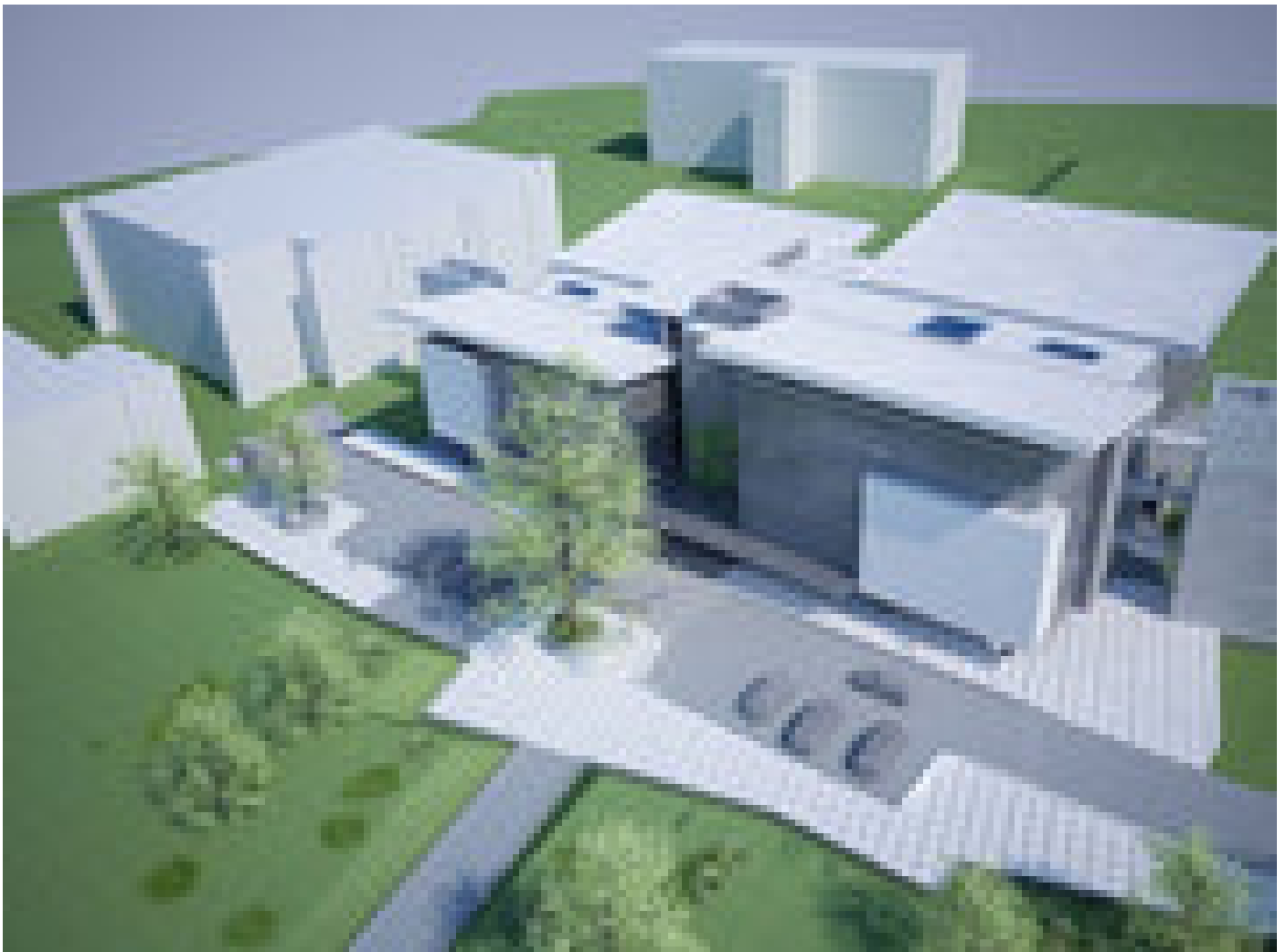
Modelo tridimensional de las futuras instalaciones de la Vicerrectoría de Investigación y el Sistema de Estudios de Posgrado (imagen cortesía OEPI).

Para fortalecer la formación de profesionales en ingeniería, informática y ciencias en las diferentes regiones del país, la UCR contempla edificar módulos de aulas y laboratorios especializados en las sedes de Occidente, Guanacaste, Limón, Pacífico y Atlántico , según las necesidades de las carreras de ingeniería de cada región y en la Escuela de Biología.