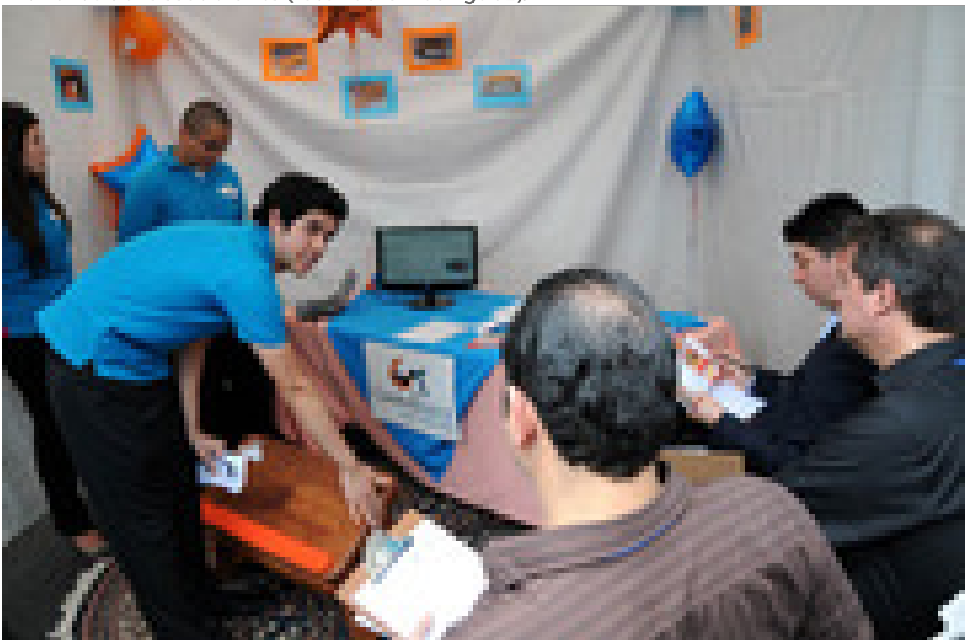
El jurado visitó cada puesto para conocer los detalles de producto o servicio. Aquí en el puesto de “Conforttable”, una mesa liviana plegable y portátil para estudiar o trabajar elaborada con madera de melina.