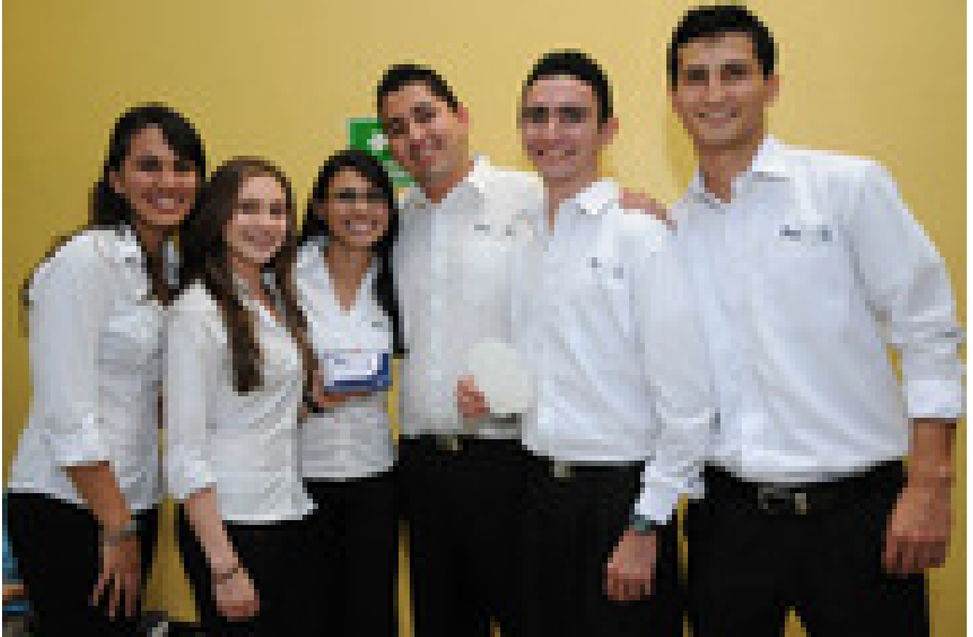
Los estudiantes de cuarto año de Administración de Negocios creadores de Proaxx.

Los estudiantes que participaron en la Expoinnova son de los cursos de Introducción a los Negocios y de Empresariedad e Innovación de la carrera de Dirección de Empresas.