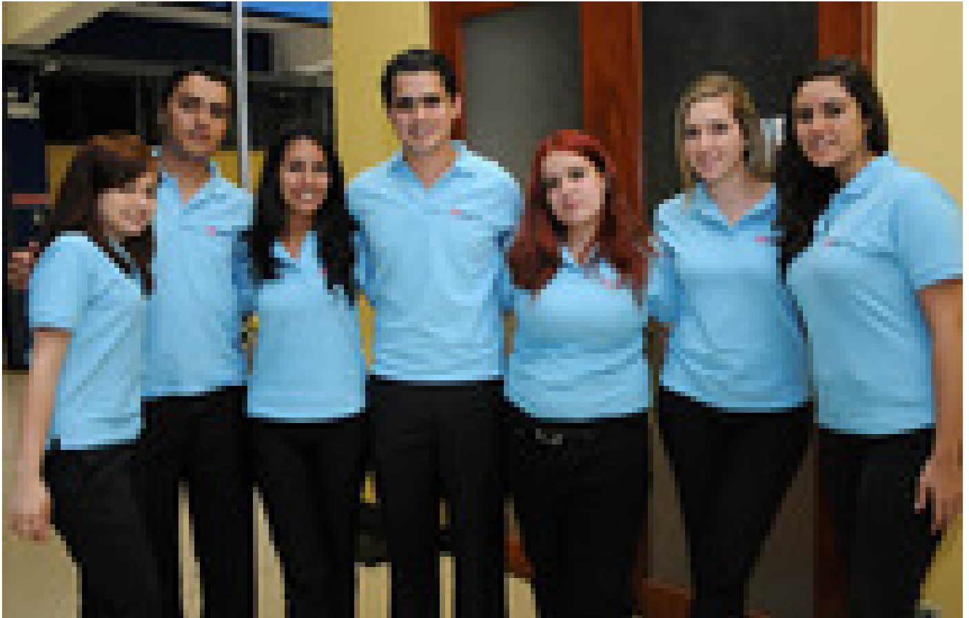
El grupo que creó Body Flex, segundo lugar de la Expoinnova.