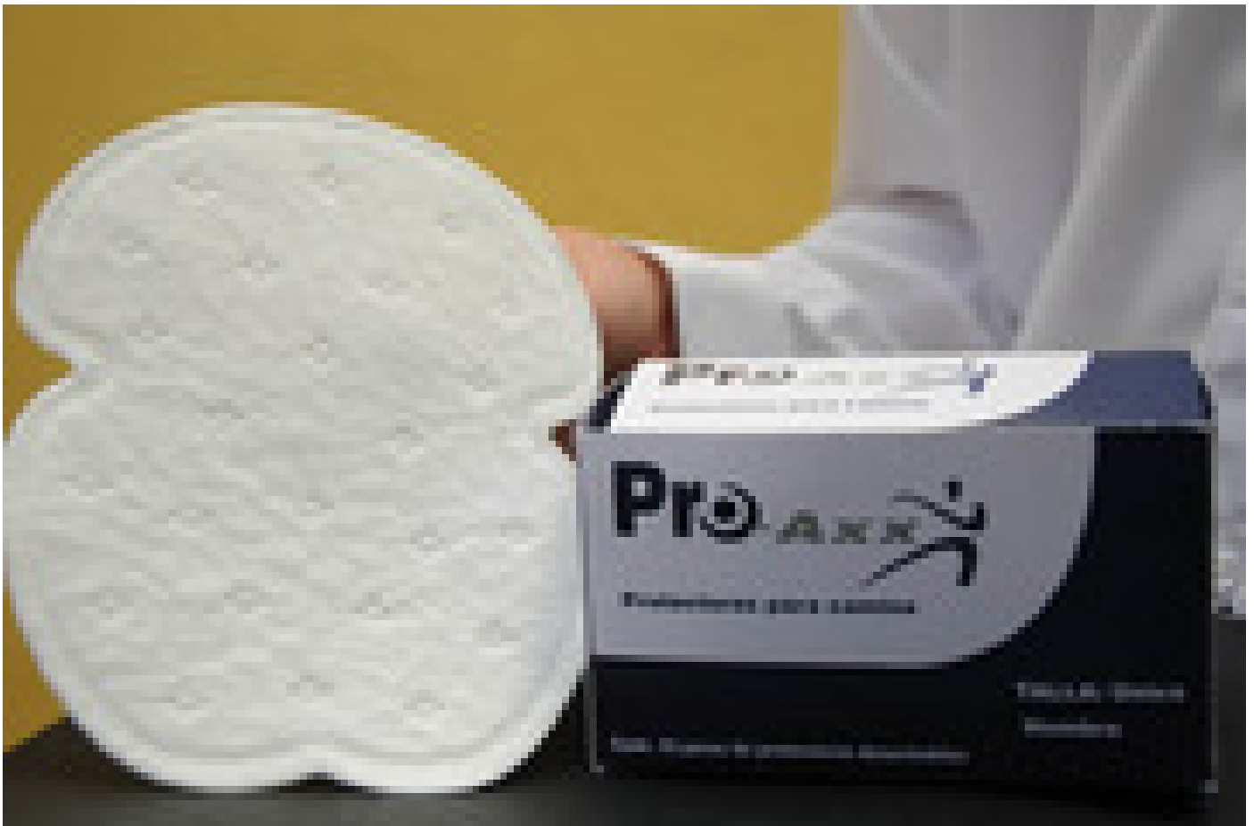
El prototipo de Proaxx, una toalla absorbente que protege la ropa del sudor excesivo y las manchas del desodorante.