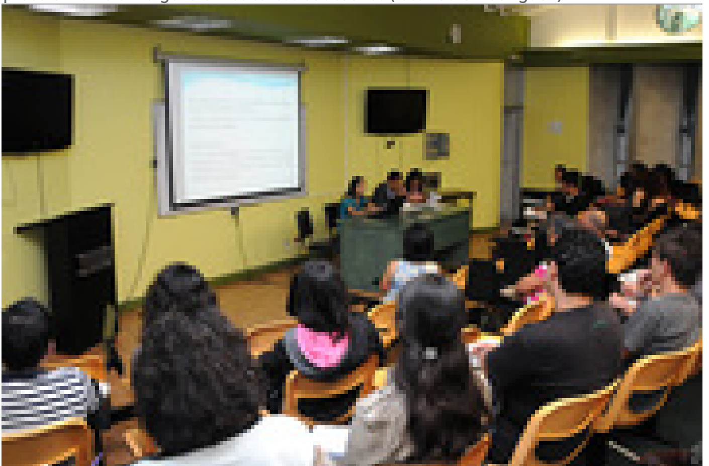
El público escuchó con atención la información que dio cada uno de los ponentes.