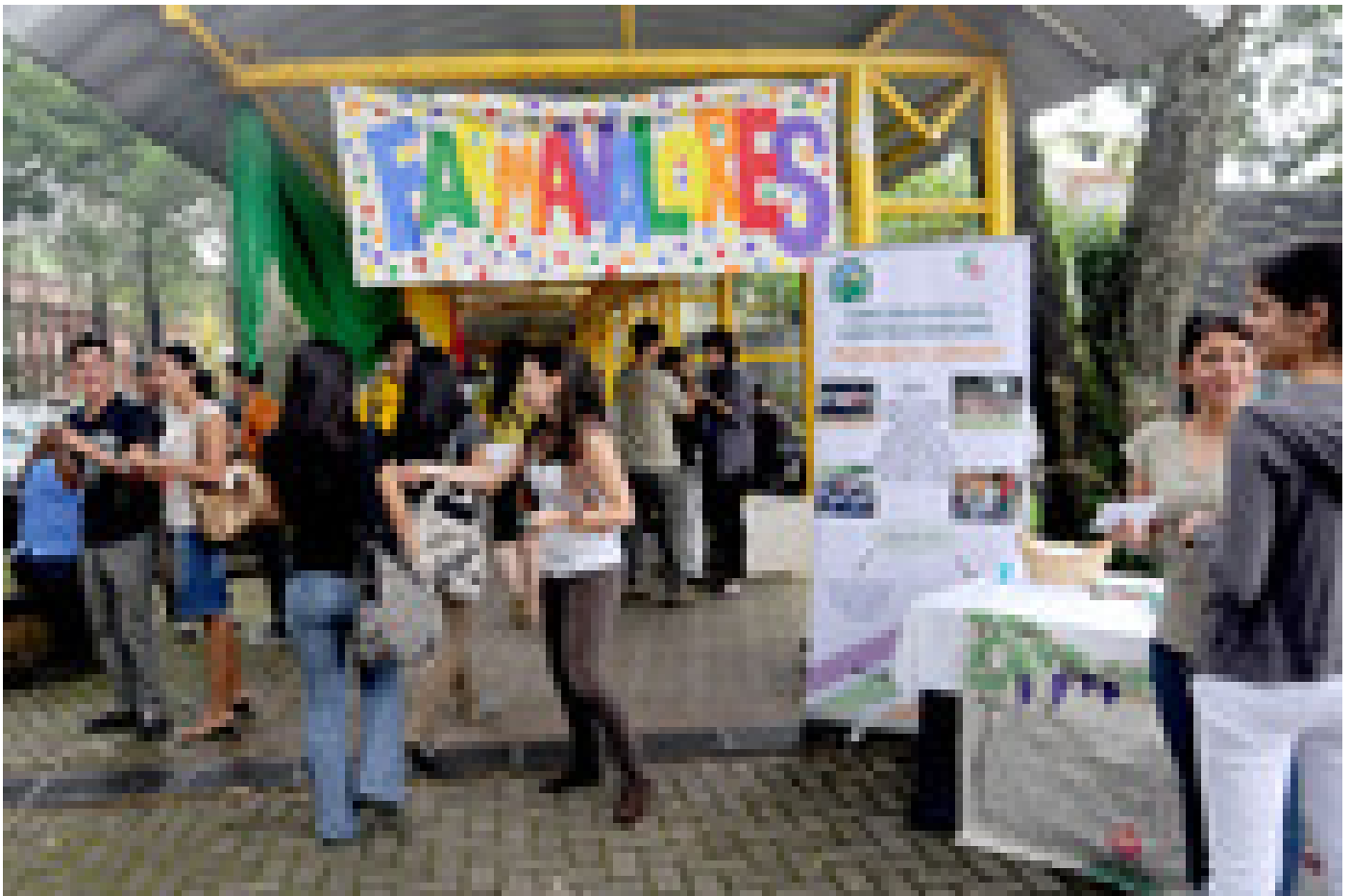
Los estudiantes distribuyeron materiales educativos a todas las personas que transitaban por el lugar.