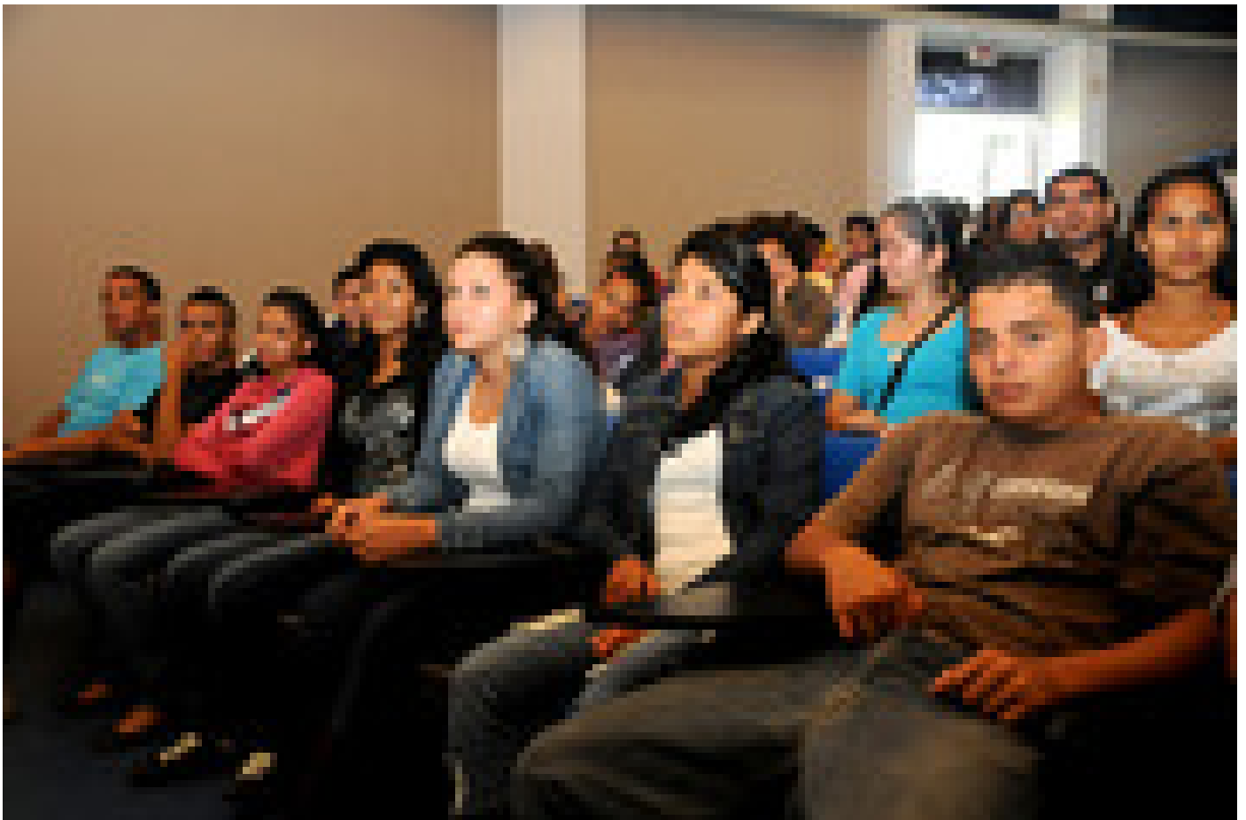
El público joven también estuvo presente en el simposio.

La consultora considera que Costa Rica ha alcanzado notables progresos en el cumplimiento de metas en el campo de la salud, como son los indicadores de mortalidad infantil y de mortalidad de menores de 5 años , pero añadió que aún persisten desigualdades en el acceso a los servicios de calidad, al maltrato y la violencia intrafamiliar, a la explotación sexual y la pornografía infantil, al consumo de drogas, el embarazo precoz y no deseado, la educación, la cobertura y la calidad de los servicios de agua y de saneamiento, entre otros.