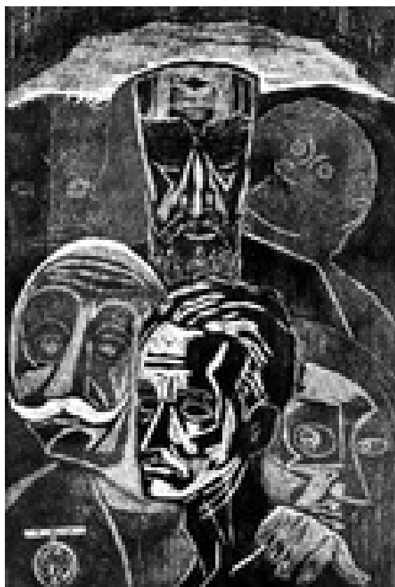
Xilografía Autoretrato con antepasados, de Francisco Amighetti, de 1968