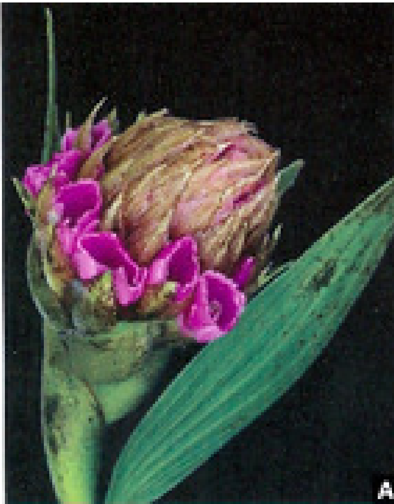
Elleanthus carinatus, una nueva especie de orquídea identificada en Costa Rica