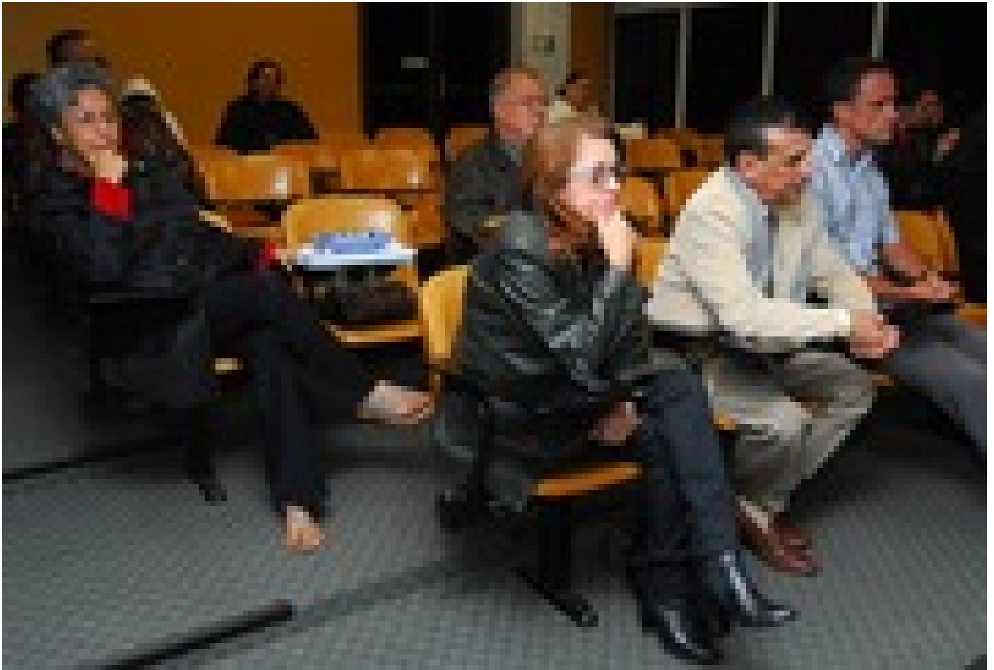
Colaboradores y amigos se reunieron en el Auditorio Roberto Murillo para conmemorar los 35 años de la Revista de Filología y Lingüística.