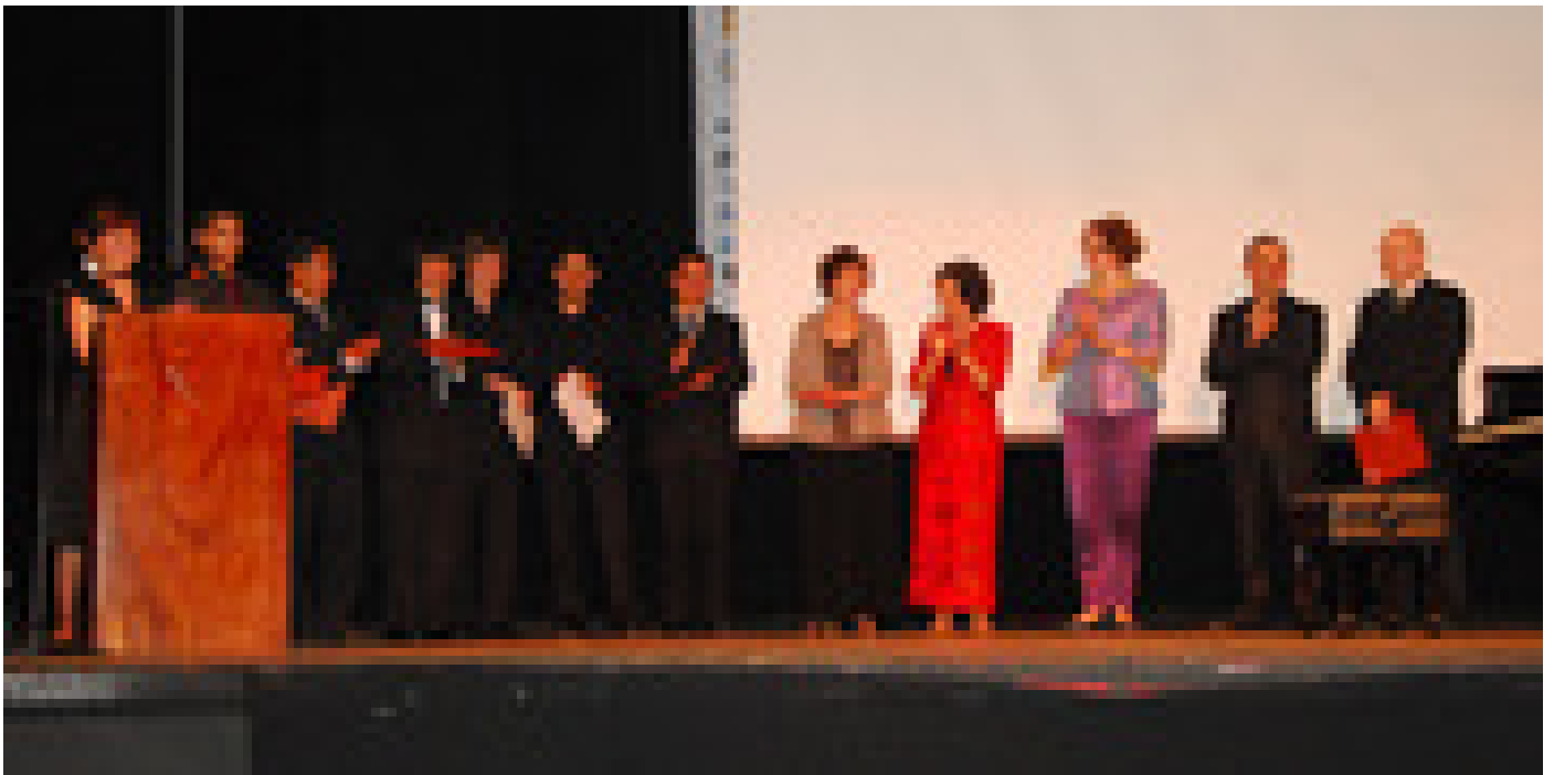
Los jóvenes ganadores del VI Concurso “María Clara Cullell” con el jurado calificador y representantes de la Escuela de Artes Musicales.