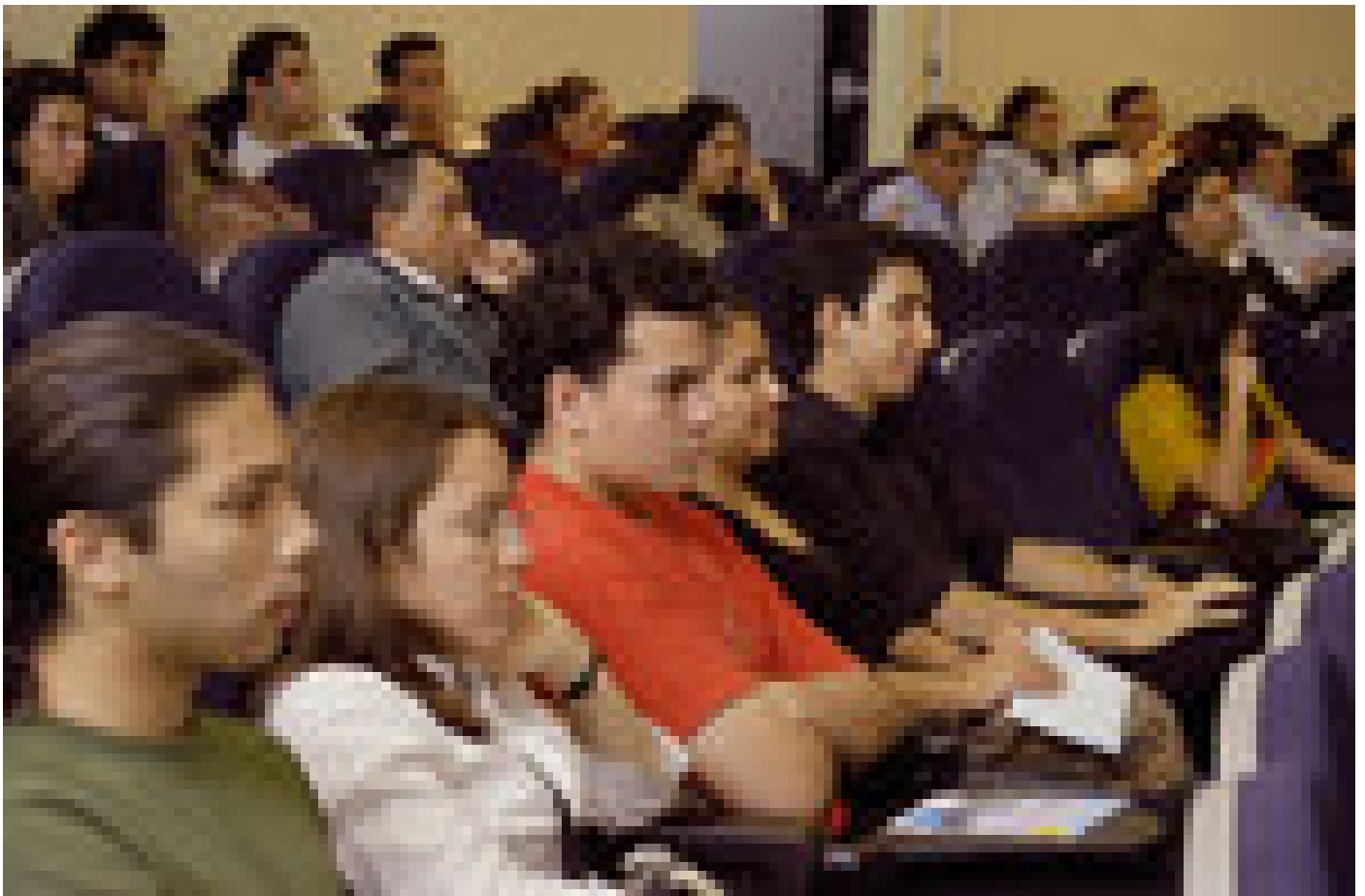
Estudiantes de la Escuela de Comunicación Colectiva, universitarios y público en general, asistieron al Segundo Foro Institucional sobre el futuro de la radiodifusión en Costa Rica

Aunque si bien es cierto las ventajas son muchas cómo más canales, mejor calidad de la imagen y el sonido sin duda tendrá una fuerte repercusión en las personas.