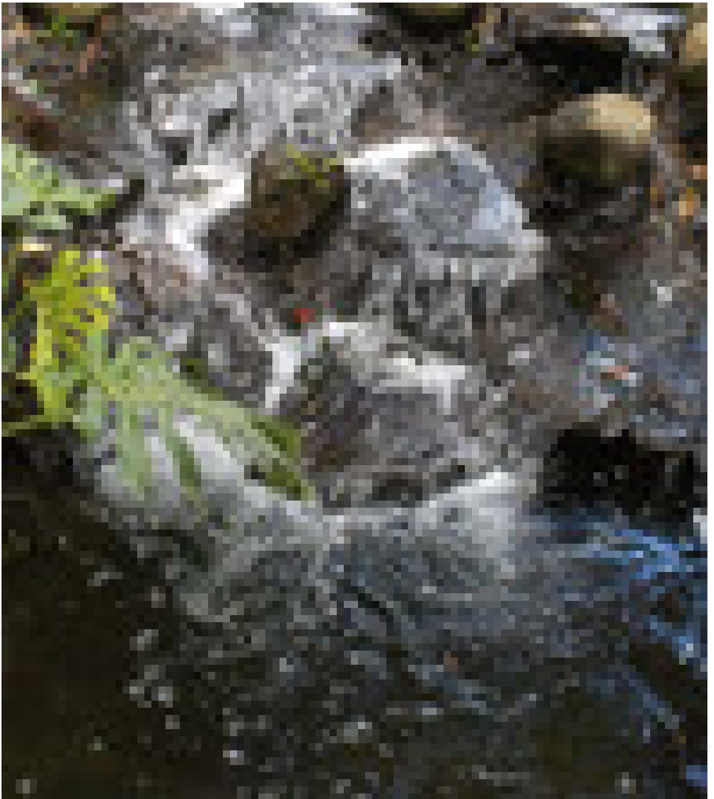
La ley hídrica nacional data de los años cuarenta del siglo pasado