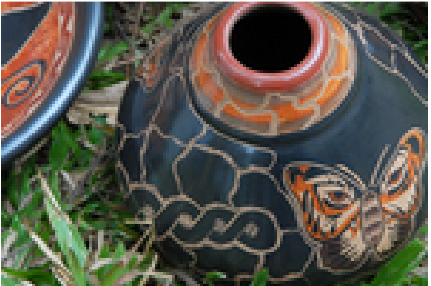
Productos artesanales están en exhibición y a la venta.

Los edificios de Estudios Generales, Derecho y Ciencias Económicas y sus alrededores son sede de más de 400 proyectos de investigación y docencia. En las afueras de estos edificios hay tarimas con espectáculos artísticos simultáneos que se ofrecerán a lo largo de este fin de semana.