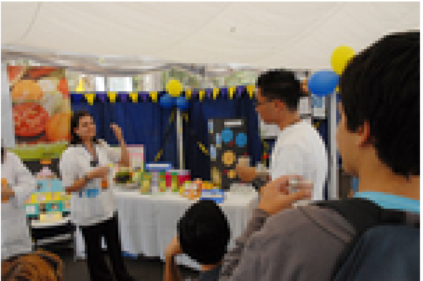
La Escuela de nutrición brinda charlas durante todo el día sobre información importante relacionada con un estilo de vida saludable.