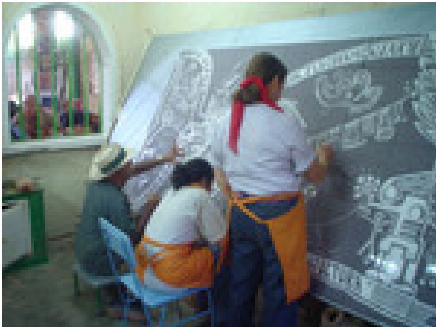
Mural colectivo elaborado por las y los artistas participantes en el VI Simposio Internacional de Cerámica. (Foto Marcela Salas).

Marcela Salas ha participado en más de treinta exposiciones colectivas en grabado, dibujo y cerámica, en un encuentro centroamericano de mujeres artistas, en cinco ferias, en un simposio internacional de cerámica, y en más de diez concursos y bienales realizadas en universidades, centros culturales, embajadas, museos e instituciones públicas y privadas.