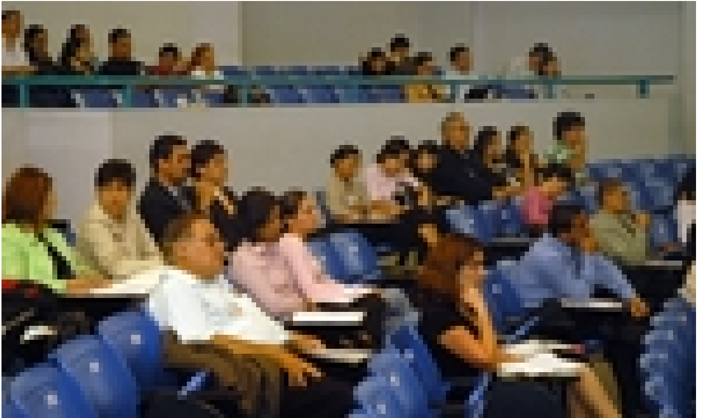
El I Simposio Internacional de Violencia y Sociedad se llevó a cabo en el Auditorio de la Ciudad de la Investigación de la Universidad de Costa Rica.

La experta manifestó que la situación de desigualdad en Brasil es preocupante. A pesar de que han disminuido los índices de pobreza, también ha aumentado el número de personas millonarias, lo cual amplía la brecha social y económica, y da como resultado una sociedad altamente desigual.