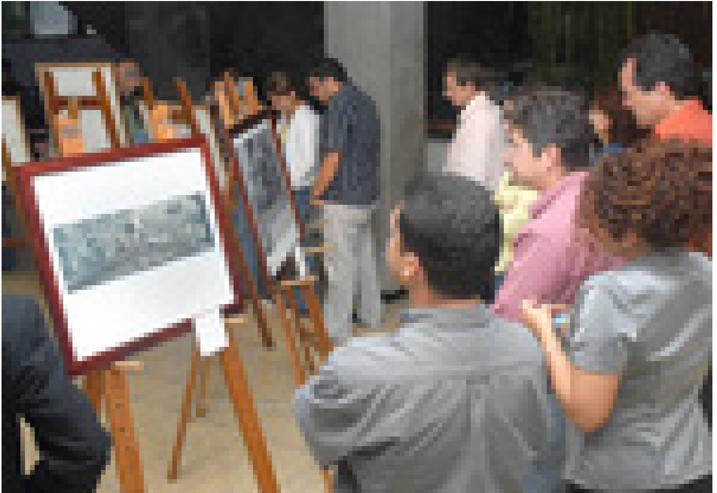
La exposición de fotografías de don Paco Amighetti ha atraído a numeroso público.

De acuerdo con lo dicho por el profesor de la Escuela de Artes Plásticas y curador de esta muestra, Carlos Guillermo Montero “no hemos encontrado mejor manera para rendir homenaje al maestro que esta exposición de fotografías de su vida, su obra y sus contemporáneos. Este proceso de investigación se inició en el curso de Arte Costarricense y continuará en el futuro con el aporte de las nuevas generaciones de estudiantes de esta disciplina”.