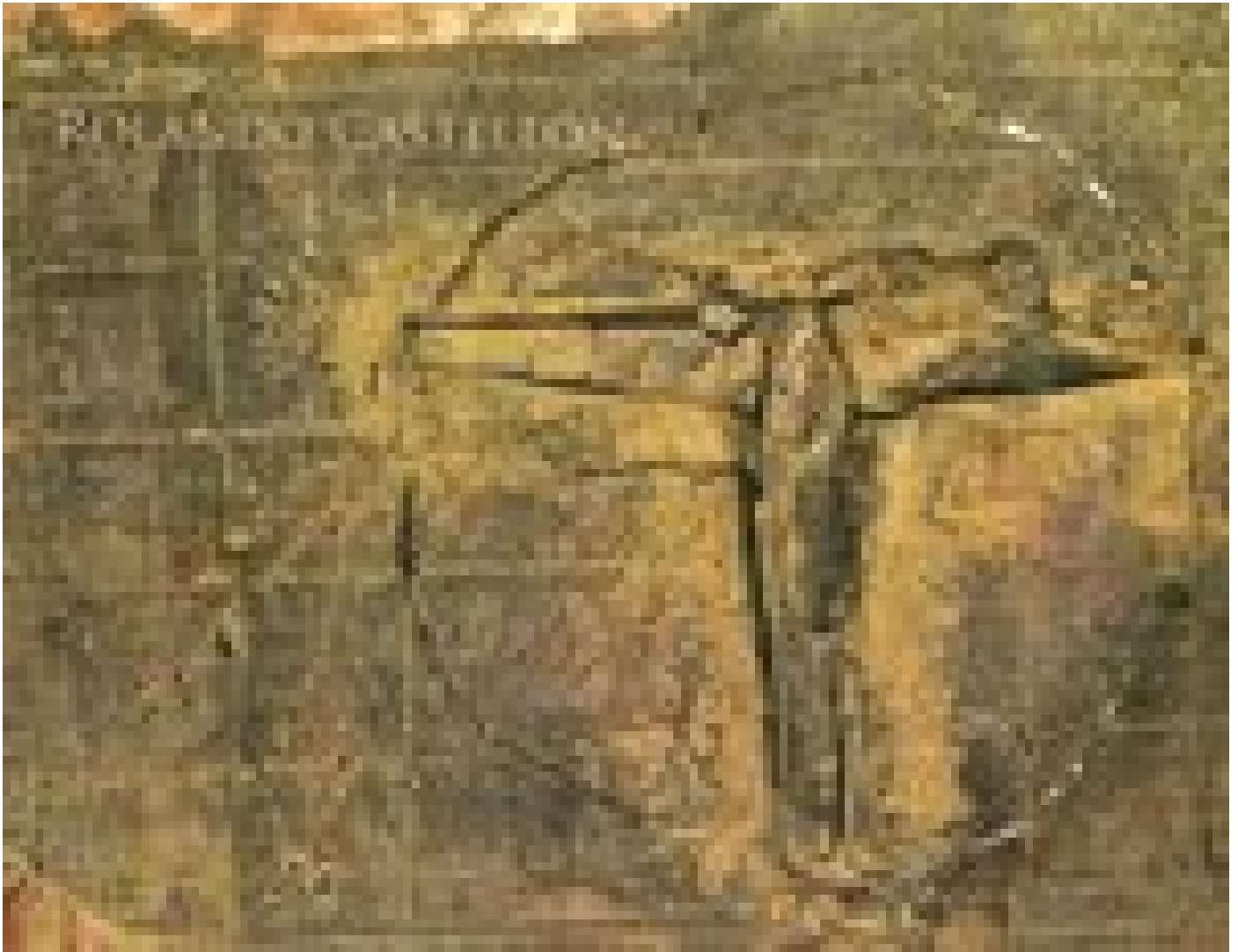
Rolando Castellon, catalogo publicado por Ars Teoretica.

La obra artística de Rolando Castellón incluye principalmente pinturas e instalaciones con objetos encontrados como ramas, piedras y metales de desecho.